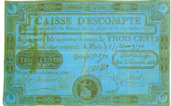
▲ Fransa'da Caisse d'Escompte'un 1790 tarihinde çıkardığı 300 livrelilik banknot (12,4x19,4 cm. A. Pick, Altes Papiergeld , s. 26).

kâğıt para uygulamasına başlar. Bankanın kasalarının kısa sürede piyasada tutunan bu paraların karşılığı olan altın ve gümüşle dolması üzerine 4 Aralık 1718'de banka devletleştirilerek ismi La Banque Royale olarak değiştirilir; banknotların tedavülü mecburî hale getirilerek kral tarafından garanti altına alınmış olur. Law, banka devletleştirildikten sonra da müdürlüğünü sürdürür. 20 Bu zorunluluğun sağladığı serbestlikten yararlanan Law'ın piyasaya devamlı para sürmesi neticesinde tedavül eden kâğıt paranın miktarı bir sene içerisinde 1 milyar livreyi bulur. Bu tür uygulamalardan ötürü tüccar ve çiftçinin kâğıt parayı alışverişlerde kullanmak istememesi üzerine hükümet, 1720 yılında altın para kullanımını yasaklar. Aynı yıl piyasaya sürülenlerle beraber kâğıt paranın toplam miktarı 2,5 milyar livreyi aşar. Bu ise yüksek bir enflasyona neden olduğu için Paris'te fiyatlar %88 oranında artar. 21 Banknotların değerinin yarıya düşmesi ve bunların mal sandıklarından kabul edilmeyeceğinin açıklanması üzerine 1721 yılında halk parasını almak üzere bankaya hücum eder. Talepleri karşılayamayan bankanın iflasını ilan etmesi üzerine toplumsal nefretin odağı haline gelen Law ülkeden kaçmak zorunda kalır. 22 Bu ise halkın