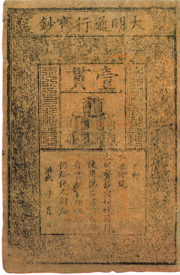
▲ Çin'de Ming hanedanlığı zamanında 1368-98 Büyük Savaş sırasında çıkarılan matbu kâğıt para (22,5x34 cm. A. Pick, Altes Papiergeld , s. 6).

Marko Polo, Kubilay Han'ın ülkesinde tedavül eden kâğıt paranın hazırlanışı, fonksiyonları ve durumunu şu şekilde tasvir eder: "Hanbalık'ta Büyük Kağan'ın darphanesi bulunmaktadır. Simyacıların aradığı gizlin burada bulunduğunu gerçekten söyleyebiliriz, çünkü burada para yaratmanın yolu bilinmektedir. Yaprakları ipek böceklerine yem olan dut ağacının kabuğu soyulur. Buradan pürüzlü dış kabukla ağacın tahtası arasında kalan ince iç kabuk çıkarılır, yumuşatılarak lapa gibi oluncaya dek havanda dövülür. Bundan, pamuktan yapılan kâğıda benzeyen ancak kapkara